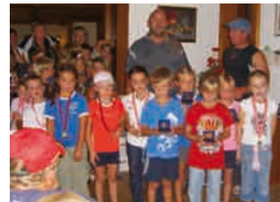
Die Kleinsten der Clubmeisterschaft 07 - U10 Kleinfeld.