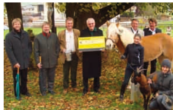
Scheckübergabe an die Krebshilfe