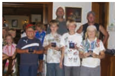
Die Sieger des Bewerbes U10 männlich - Großfeld.