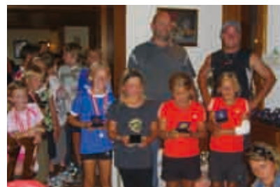
Die Preisträger der Klasse U10 weiblich - Großfeld.